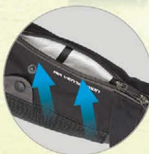
Belüftungssystem mit 2-Wege-Reißverschluss an den Ärmeln