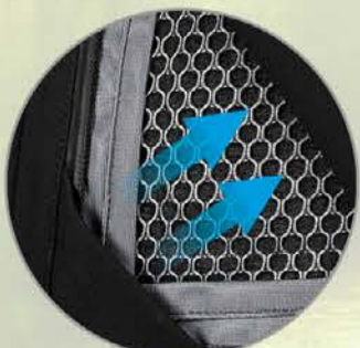
Belüftung an der Front, Entlüftung am Rücken