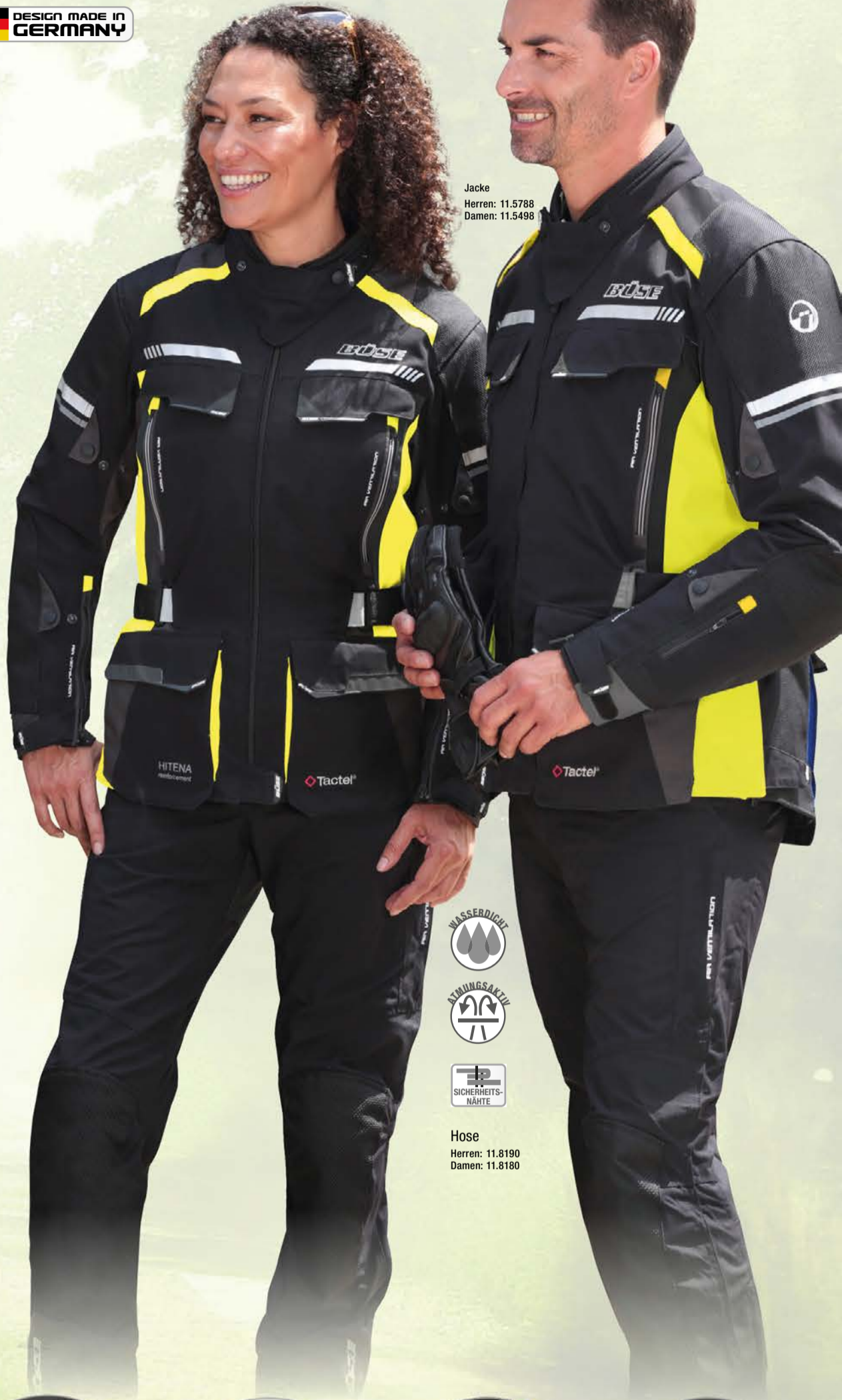
Jacke Herren: 11.5788 Damen: 11.5498