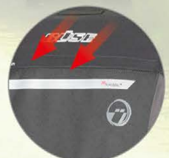
Entlüftung am Rücken