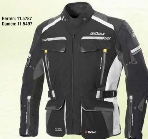
Herren: 11.5787 Damen: 11.5497