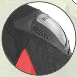
Hartschalen mit Metalleinsätzen an den Schultern