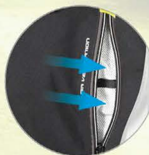
großflächiges Belüftungssystem im Brustbereich