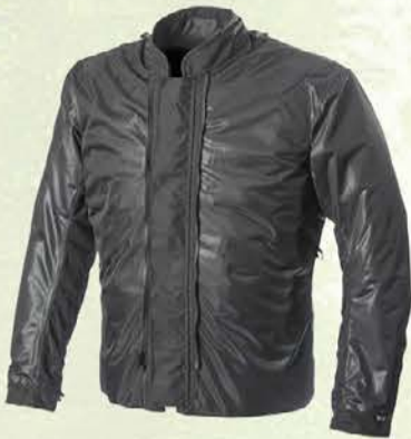
entnehmbare Humax® Klimamembran mit integriertem Thermofutter auf der Brust

MOTOPLUS Oordeel: goed Heft 11/2023 9 textiel-motorfiets combinaties in de test: zeer goed (3), goed (5), voldoende (1)